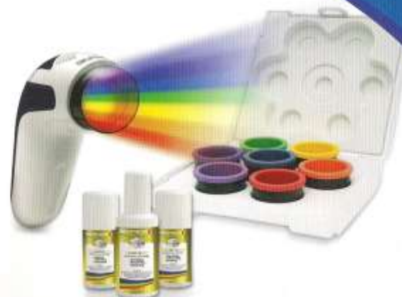
BIOPTRON Bioinformación sobre puntos de presión & Set de Chakras de Cromoterapia PAG-965

La falta constante de colores nos hace susceptibles a las enfermedades y a la depresión. En el momento en que el sol sale y colorea nuestro pequeño planeta, nuestros problemas parecen desaparecer y al instante recobramos la energía y un ánimo feliz.