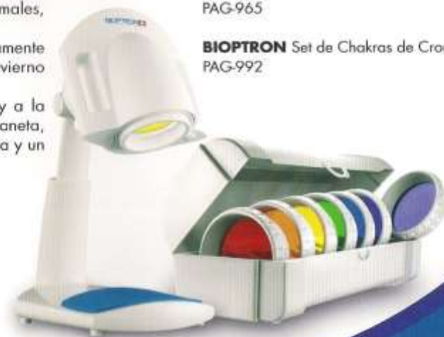
BIOPTRON Set de Chakras de Cromoterapia. PAG-992